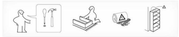
Moderne Kompetenzen : Montageanleitung eines schwedischen Möbelhauses verstehen.

Literatur gibt Orientierung und lässt eine kulturelle Identität entstehen. Bildung wird mit Büchern geradezu greifbar. Die Statistik hat herausgefunden, dass heutzutage mehr Bücher denn je gekauft werden. Werden sie aber auch gelesen? Die Konkurrenz aus leichter konsumierbaren Medien wie Film, Fernsehen und Internet ist groß. Bedenken, dass das Buch durch die elektronischen Medien verdrängt würde, sind unbegründet.