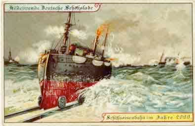
In hundert Jahren werden wir mit Schiffseisenbahnen reisen .

Um das Jahr 1900 legten die Schokoladenfabrikanten ihren Produkten Postkarten bei mit Vorstellungen darüber, wie die Welt im Jahr 2000 aussehen werde. Einiges traf ein, vielleicht in etwas anderer Form.