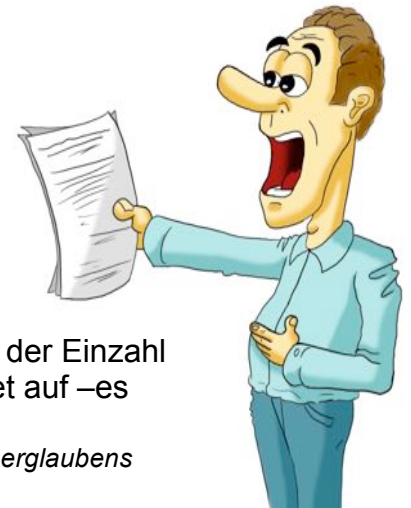
der Inhalt der Rede