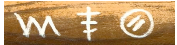
Bissiger Hund - Hier wohnt Polente - Man ruft die Bullen

Eine moderne Variante der Gauernerzinken ist das sogenannte WarChalking (engl. chalk „Kreide“), bei dem offene oder öffentlich zugängliche WLANs kenntlich gemacht werden.