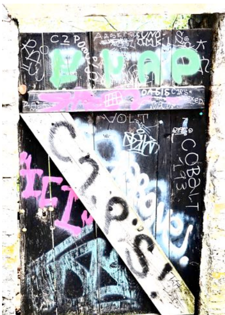
Tag heißt die „Unterschrift“ eines Sprayers, womit er - ähnlich wie ein Hund - sein Revier kennzeichnet.

Die stilisierten Zeichen wurden mit Kreide oder Kohle gezeichnet oder mit einem Messer eingeritzt. Sie waren besonders an Orten zu finden, die von vielen möglichen Adressaten aufgesucht wurden: Aborte in Wirtshäusern oder Bahnhöfen, an Ortseingängen, an Kirchenmauern. Inhalte der grafischen Zinken waren meist Informationen für Nachreisende.