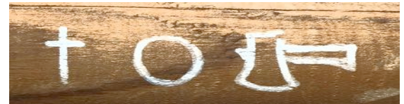
Fromm tun! - Nichts zu holen - Hier muss man malochen