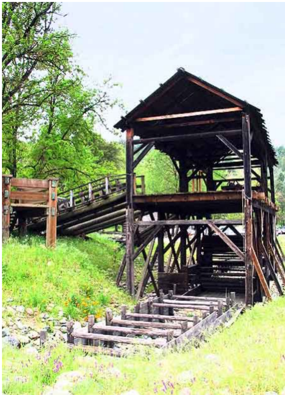
Sutters Sägemühle in Coloma (Rekonstruktion)

1848, im Januar. Plötzlich kommt James W. Marshall, sein Schreiner, aufgeregt zu Johann August Sutter ins Haus gestürzt, er müsse ihn unbedingt sprechen. Sutter ist erstaunt, hat er doch noch gestern Marshall hinaufgeschickt in seine Farm nach Coloma, dort ein neues Sägewerk anzulegen. Und nun ist der Mann ohne Erlaubnis zurückgekehrt, steht zitternd vor Aufregung vor ihm, drängt ihn in sein Zimmer, schließt die Tür