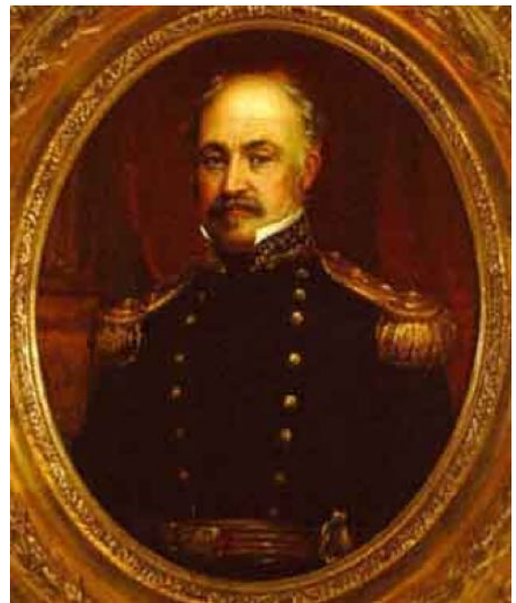
John A. Sutter um 1860

Und nun tritt Johann August Sutter plötzlich vor mit seinen Ansprüchen. Der ganze Boden, so heischt er, auf dem die Stadt San Francisco gebaut ist, gehört ihm nach Fug und Recht. Der Staat ist verpflichtet, den Schaden, den er durch Diebstahl seines Eigentums erlitten, gutzumachen, an allem aus seiner Erde geförderten Gold beansprucht er sein Teil. Ein Prozess beginnt in Dimensionen, wie sie die Menschheit vor ihm nie gekannt. Sutter verklagt siebzehntausendzweihunderteinundzwanzig Farmer, die sich in seinen Pflanzungen angesiedelt haben, und fordert sie auf, den