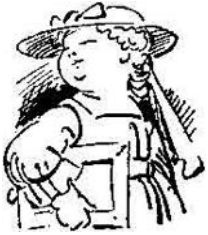
Und mit teilnahmsvollem Sinn schaut sie gern nach Knaben hin.

Unsre dicke, nette Jule geht bereits schon in die Schule.