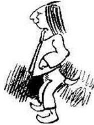
Einer, der ihr nicht gefiel, das ist Dietchen Klingebiel.