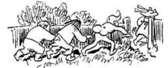
Kränkend ist ein solches Wort. Julchen eilt geschwinde fort.

Böse Knaben gibt's noch viele, zeichne zwei nach deinem Stile!