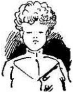
Försters Fritze, blond und kraus, ja, der sieht schon besser aus.