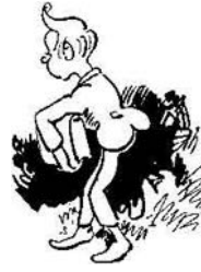
Ferdinandchen Mickefett scheint ihr nicht besonders nett.